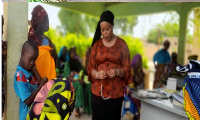
Causeries éducatives animées dans les CScm