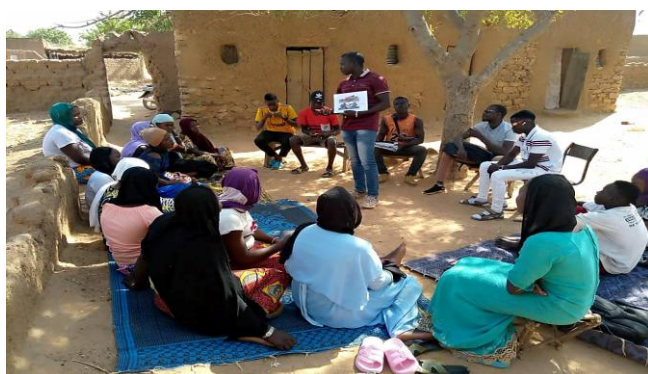
Causeries éducatives réalisées par les Jeunes

Ce processus permet aux jeunes de transmettre des informations fiables à leurs pairs, impliquer les parents dans les discussions sur la santé reproductive, et promouvoir des choix responsables. Le renforcement des capacités inclut aussi la microfinance communautaire. Les résultats montrent que cette approche a permis de former des jeunes leaders et de mobiliser des ressources, prouvant l'efficacité de la stratégie.