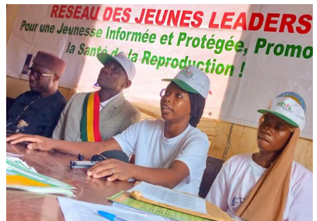
Activités de sensibilisation des Elus Communaux sur la promotion de santé reproductive des adolescents et jeunes