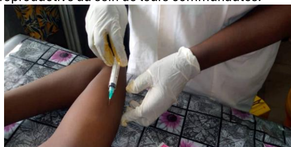
Utilisation des produits contraceptifs par les Jeunes

La participation active des jeunes dans les campagnes de sensibilisation (Planification Familiale, 16 Jours d'Activisme, etc.), en faisant d'eux des acteurs clés de la promotion de la santé reproductive au sein de leurs communautés.