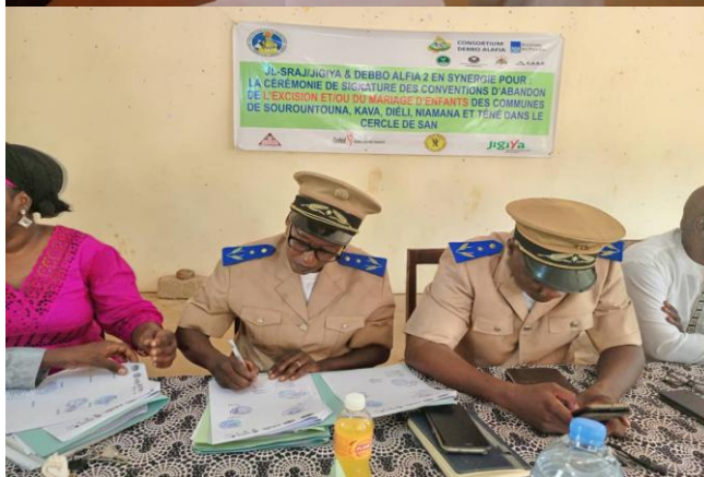
Signatures de Conventions d'Abandon contre les pratiques de l'Excision et du Mariage d'Enfants