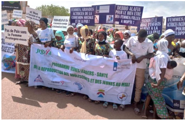
Campagne de sensibilisation réalisée par les jeunes

749 Communautés ont signé des conventions d'abandon de la pratique de l'Excision ou le mariage d'enfants