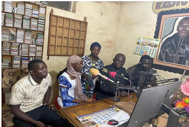
Emission Radiophonique sur la SR