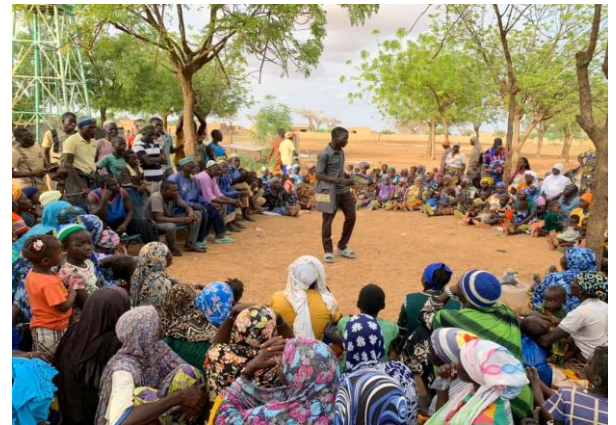
Assemblée Générale Villageoise animée par les Jeunes

Opérationnalisation d'une stratégie de plaidoyer menée par les jeunes, visant à influencer les décisions familiales et communautaires en faveur de la SRAJ, avec des mécanismes de suivi d'impact clairement définis