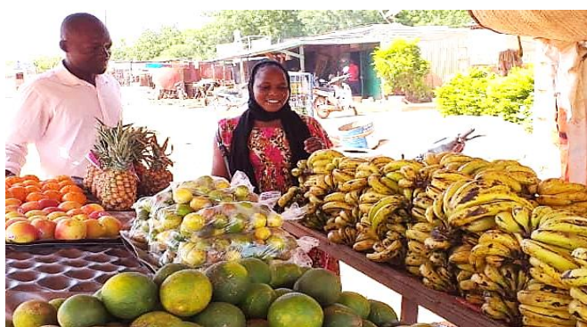
Activités Génératrices de Revenus réalisées par les Jeunes