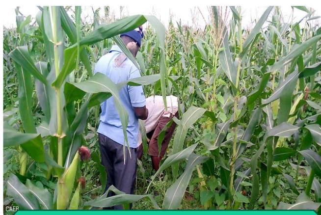
Physionomie des champs de maïs au moment placement des carrés de rendement