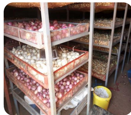
Production, transport et conservation de l'échalote de la coopérative Jama Jigui de Sandaré