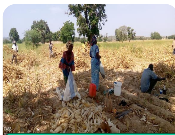
Récolte dans un champ collectif de Maïs