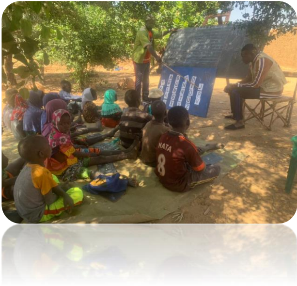
Suivi de l’animation d’un groupe d’écoute dans le village de Doundé, commune de Ségué, cercle de Bankass

Partenaire Technique et financier : Terre des Hommes (TDH)